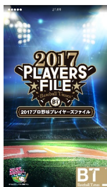
スプラッシュ画面